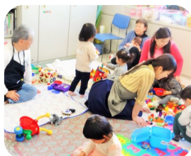
En la guardería del curso de japonés.

Juegan con los niños en varios idiomas como japonés, inglés, coreano, francés, etc.