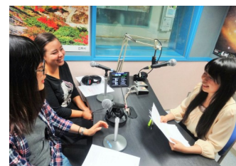
Hablan invitados extranjeros en japonés. ¡En vivo!

El 27 de enero (Brasil), el 24 de febrero (Rusia) y el 24 de marzo (Uzbekistán).