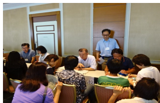
个别咨询会(有翻译陪您咨询)