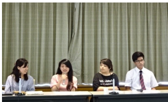
Orientación: los estudiantes nos contarán su experiencia