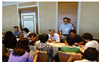
Consulta personalizada: disponible en los diferentes idiomas

Para padres e hijos cuya lengua materna no es el japonés Orientación para el ingreso al koukou (bachillerato o escuela secundaria superior)