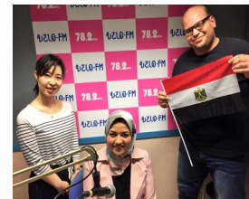
En el estudio de Musashino FM.

El 27 de julio, el 24 de agosto y el 28 de septiembre.