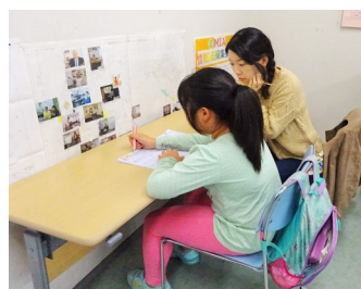
Cada voluntario atiende a un alumno individualmente

Si desea empezar antes, consulte con MIA.