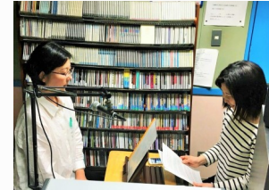
Grabando las noticias.