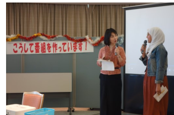
武藏野国际交流节中的情景