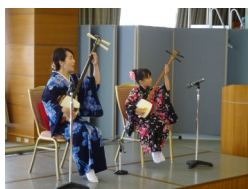
← 古筝、折纸、书法、围棋等等 可以看表演、可以体验, 欢迎大家一起共度愉快的时光!

6月27日(周六)15:00-17:00 SWING大厦11楼。家庭和留学生互相介绍文化, 进行交流。可以表演自己的特长, 也可以向别人请教。有能在大家面前表演节目的人请与MIA联系。