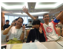
“初次见面”留学生和家庭第一次见面。

4月25日(周六)13:30-16:00 SWING大厦11楼。给同学们介绍此后一年进行交流的家庭。想交流的留学生请在4月10日(周五)之前报名登录。亚细亚大学・成蹊大学・东京农工大学・东京外国语大学・东京女子大学的留学生请到自己大学的留学生课或国际交流中心等留学生窗口报名申请“武藏野市国际交流协会(MIA)的武藏野家庭访问计划”。其他大学的同学请直接来MIA或打电话(0422-36-4511)咨询。