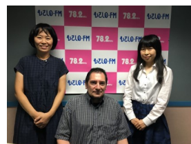
和外籍嘉宾的愉快交谈 —直播—