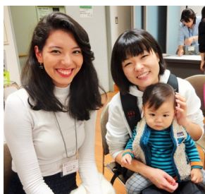
“初次见面” 这一天留学生和交流家庭第一次见面。

4月21日(周六)13:30-16:00 SWING大厦11楼。给同学们介绍此后一年进行交流的家庭。想交流的留学生请在4月10日(周二)之前报名登录。亚细亚大学・成蹊大学・东京农工大学・东京外国语大学・东京女子大学的留学生请到自己大学的留学生课或国际交流中心等留学生窗口报名申请“武藏野市国际交流协会(MIA)的武藏野家庭访问计划”。其他大学的同学请直接来MIA或打电话(0422-36-4511)咨询。