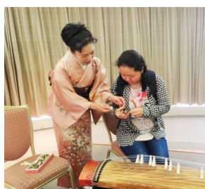
←书法、折纸、围棋、古筝等... 可以表演、可以体验,和大家一起共度愉快的时间!

6月16日(周六)15:00-17:00 SWING大厦11楼。家庭和留学生互相介绍文化,进行交流。可以表演自己的特长,也可以向别人请教。有能在大家面前表演节目的人请与MIA联系。