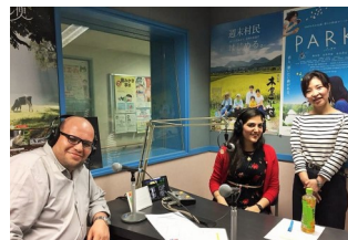
和外国人嘉宾的愉快交谈 —直播—