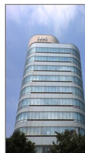
↑ Este edificio

*En la salida nonowa no se permite pasar con billete sino sólo con tarjeta de transporte como Suica y PASMO.