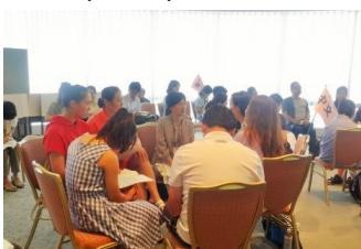
Orientación: interpretación en grupos por idiomas