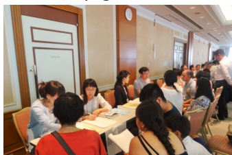
Consulta individual: disponible en los diferentes idiomas.

Del 5 de septiembre al 12 de diciembre todos los miércoles, de 15:00h a 17:00h Swing piso 9º