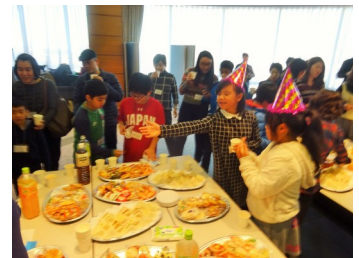
El 8 de diciembre habrá una fiesta y presentación.