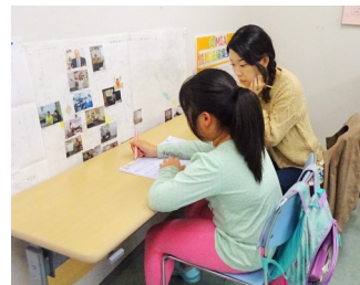
Cada voluntario atiende a un alumno individualmente.

*Si desea ingresar antes, consulte con MIA.