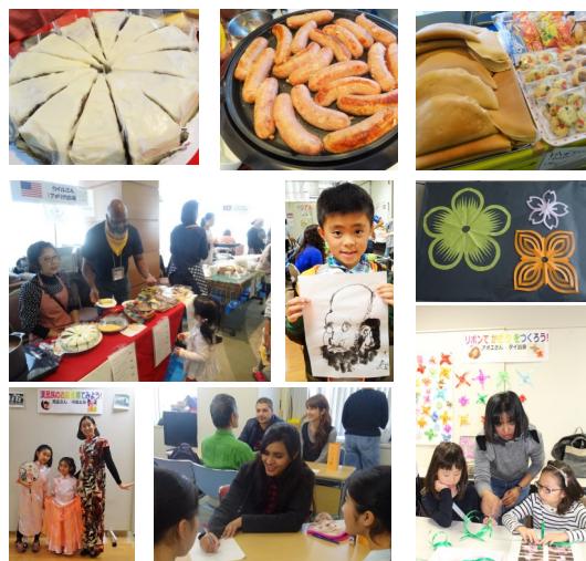
照片为去年交流节时拍摄内

●面向儿童的印章拉力赛 11:00-15:00 在11楼申请。有参加奖, 限200名!