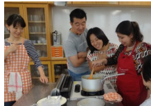
りょうりのイベントのようす